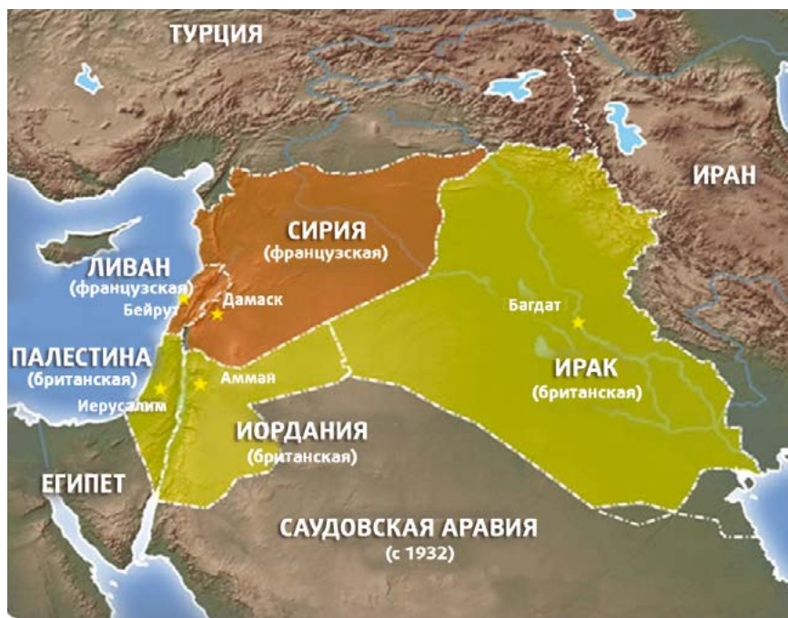
Секретный британо-французский пакт Сайкса-Пико о разделе Ближнего Востока был великим предательством арабского народа

После Октябрьской революции 1917 года, в результате которой к власти в России пришли большевики, союз с Британией и Францией против Германии распался. Советское правительство в Москве, обнаружив секретное соглашение Сайкса-Пико, немедленно опубликовало его текст в открытой печати, показав всему миру, как Британия и Франция должны были обмануть арабов, своих военных союзников. Такая политика вызвала огромное возмущение на арабском востоке, посеяв недоверие и глубокую ненависть к Западу, которые остались неизжитыми и в XXI веке. Несколько недель спустя